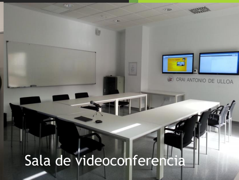
Sala de videoconferencia