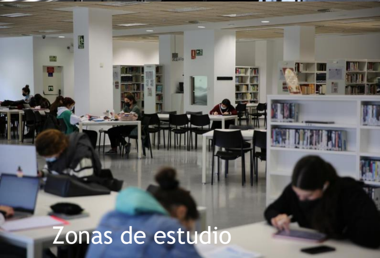
Zonas de estudio