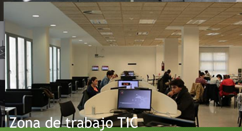
Zona de trabajo TIC