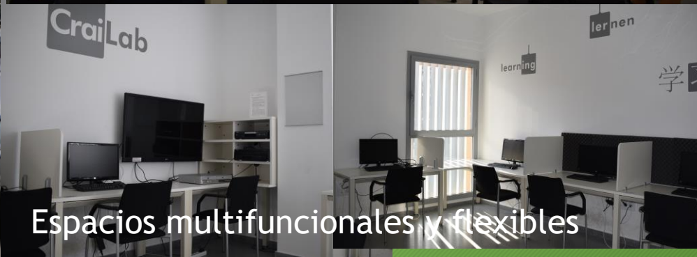
Espacios multifuncionales y flexibles