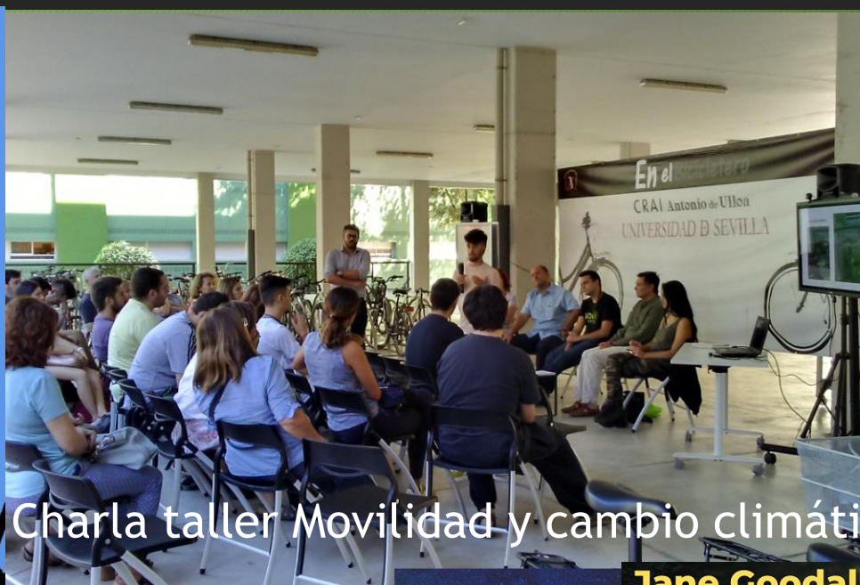
Charla taller Movilidad y cambio climático