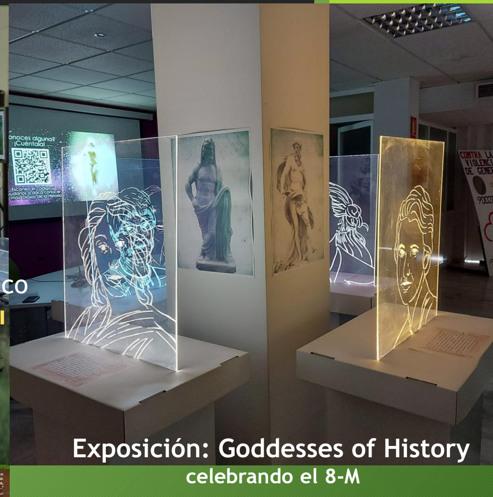
Exposición: Goddesses of History celebrando el 8-M