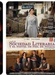
La sociedad literaria y el pastel de piel de patata