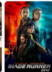
Blade Runner 2049