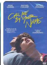
Call me by your name