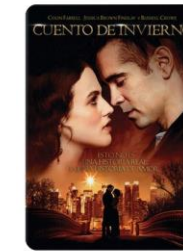
Cuento de invierno (2014)

Catálogo de películas para el aprendizaje de idiomas, elaborado por la Biblioteca de la Facultad de Turismo