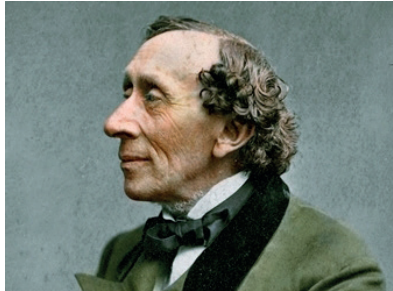
Hans Christian Andersen

Hans Christian Andersen (1805-1875) publica en 1835 su primera colección de historias para niños y continúa publicando sus obras en forma de pequeños libros hasta su muerte. Destacan de él cuentos como: El soldadito de plomo , El patito feo , La sirenita , etc.