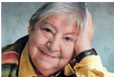
Gloria Fuertes

Sería innumerable y prácticamente imposible hablar de los autores españoles de los XX y XXI, citaré los más importantes: Gloria Fuertes (ya mencionada antes), Alfredo Gómez Cerdá, Jordi Sierra y Fabra, Juan Muñoz, Concha López Narváez, María Puncel, Pilar Mateos, o más recientemente, Laura Gallego, Roberto Santiago o Pedro Mañas.