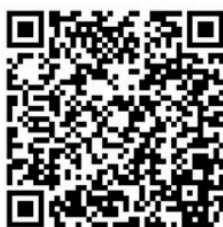
Imagen 2. Vídeo investigación “La lectura literaria y la escritura creativa como ocio en personas con Síndrome de Down”

Con el segundo colectivo, a los jóvenes con Síndrome de Down se les garantiza la accesibilidad a los textos ofrecidos, y han permitido desarrollar dos proyectos. Uno por el que hemos sido premiados por la Fundación Lara y la Universidad Internacional de Valencia en su VI edición del certamen “Enseñamos a leer” en Andalucía, Ceuta y Melilla por la investigación titulada La lectura literaria y la escritura creativa como ocio en personas con Síndrome de Down . Actualmente estamos construyendo de forma inclusiva un nuevo proyecto dentro de la tesis doctoral con el título Los Libros Ilustrados de No Ficción y Lectura Fácil, recursos inclusivos en la formación como ciudadanos críticos de jóvenes con Síndrome de Down comprometidos con la Agenda 2030. Investigación inclusiva . En este caso, vuelven a ser protagonistas los recursos inclusivos en la lectura, concretamente los libros ilustrados y los de lectura fácil. La investigación se funde con el tejido asociativo y las distintas personas participantes. La imagen 2 da acceso a un vídeo resumen del proyecto premiado.