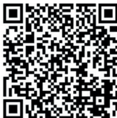
Imagen 1. Vídeo club de lectura