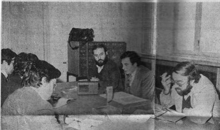
Un momento de la rueda de Prensa mantenida por el presidente de la Gestora de Asociación de Bibliotecarios Andaluces.