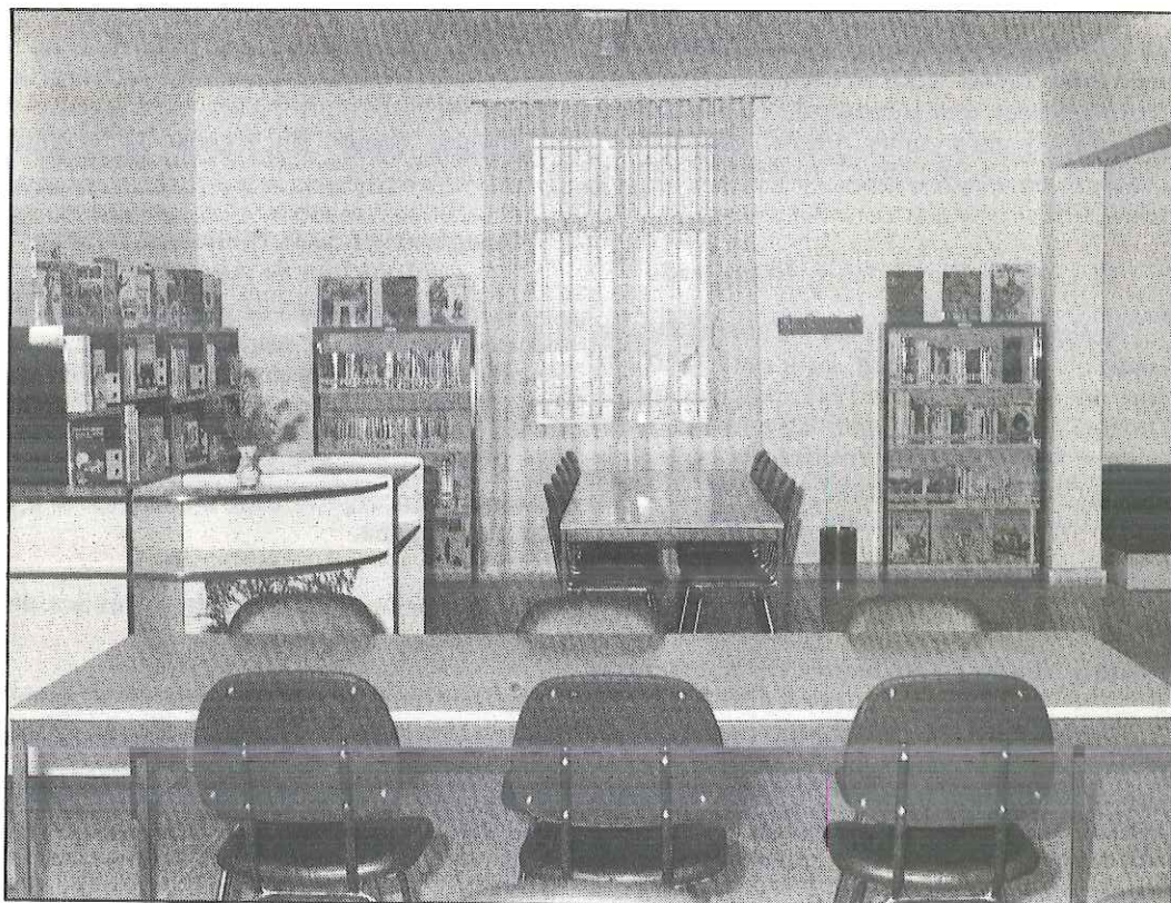
Biblioteca de Campillos.