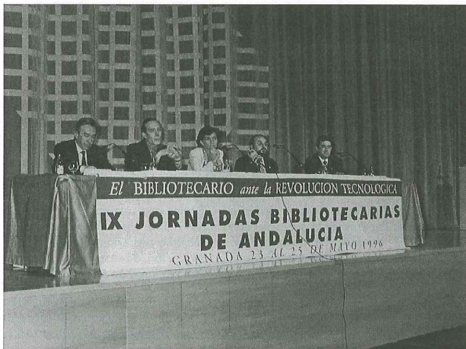
Presidencia del Acto de Inauguración

De acuerdo con el programa, a las 9'30 h. del día 23, en la inmensa e impresionante sala Federico García Lorca, dio comienzo, con la asistencia de 700 congresistas, el acto solemne de inauguración de las Jornadas. En la presidencia la Consejera