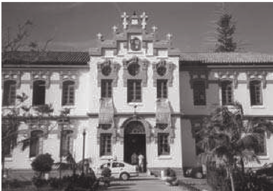
Centro Cívico de la Diputación de Málaga, lugar de celebración]

Durante los días 23, 24 y 25 de mayo tuvieron lugar en el Centro Cívico de la Diputación de Málaga las XII Jornadas Bibliotecarias de Andalucía , organizadas por la Asociación Andaluza de Bibliotecarios , y en las que colaboraron la Consejería de Cultura de la Junta de Andalucía, el Ayuntamiento de Málaga, la Diputación de Málaga, la Universidad de Málaga, el Ayuntamiento de Benalmádena y el Patronato de la Costa del Sol, y donde se dieron cita 300 bibliotecarios de toda Andalucía y del resto del país.