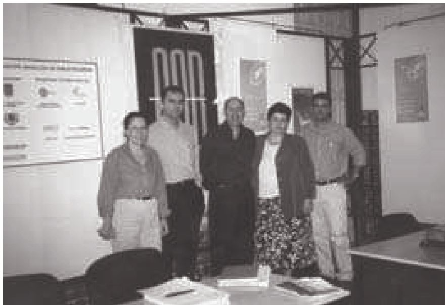
El Presidente de la AAB con miembros de la Comisión Organizadora y el Comité Científico en el stand de la Asociación