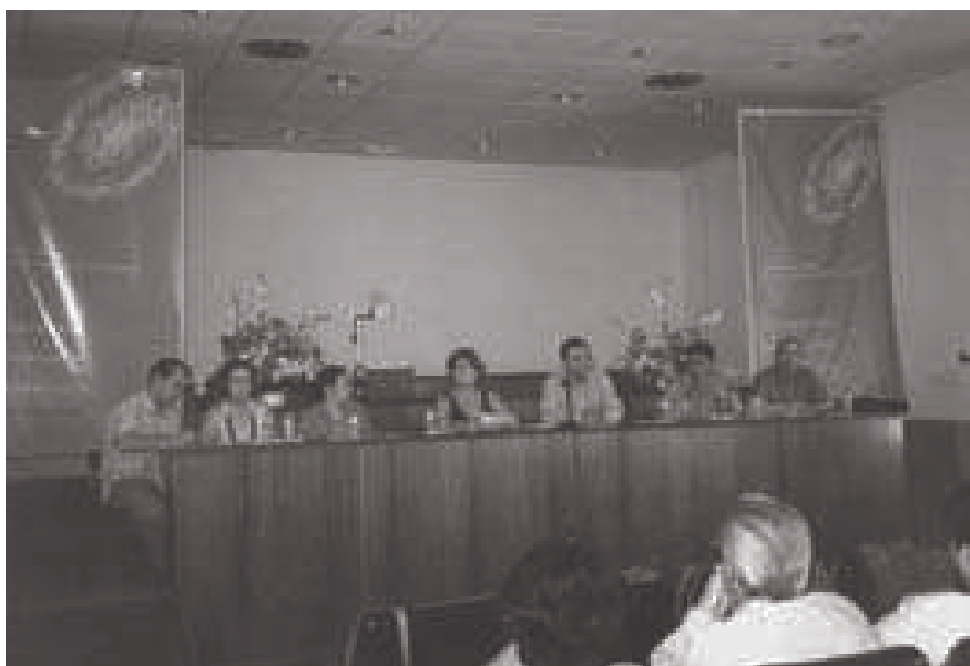
Acto de presentación y aprobación de conclusiones

Otro fue la recepción ofrecida la noche siguiente por el Ayuntamiento de Benalmádena, en el Parque de las Palomas, junto al nuevo edificio de la Biblioteca de Arroyo de la Miel, que tuvo lugar con posterioridad a la visita del Castillo de Bil-Bil.