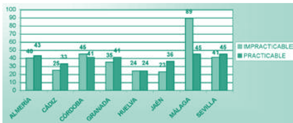
FIGURA 2 ¿SON ITINERARIOS PRACTICABLES PARA PERSONAS CON MOVILIDAD REDUCIDA EL ACCESO A LA BIBLIOTECA Y A LA TOTALIDAD DE SUS ÁREAS Y RECINTOS?