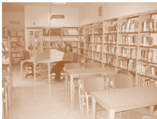
Servicio de acceso a Internet