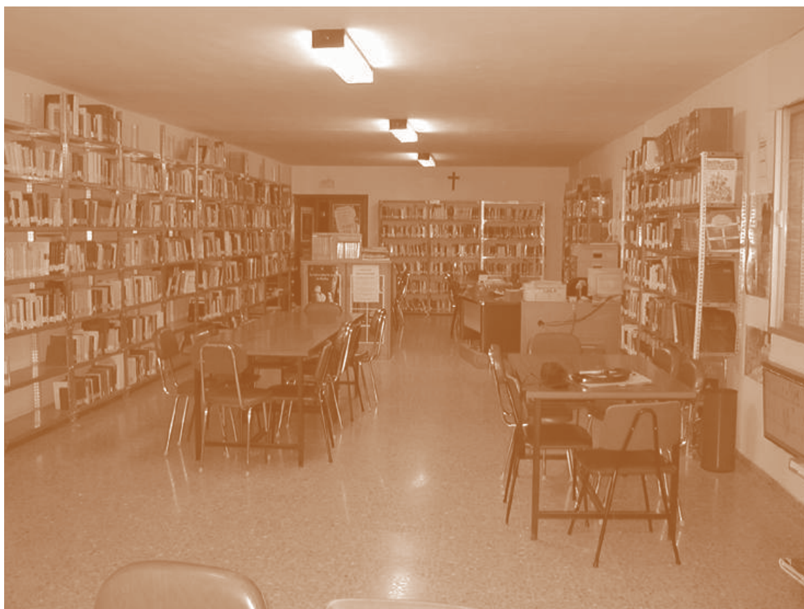
Vista general de la sala de consulta en las nuevas instalaciones de la biblioteca pública municipal de Huelma después de la reforma

Personalmente, a lo largo de todos estos años, mi mayor recompensa ha sido y sigue siendo el cariño de los niños, que serán los futuros padres que enseñarán a sus hijos el valor de la lectura como fuente de enriquecimiento personal y de una sociedad bien informada, con unos servicios bibliotecarios de calidad siempre en constante renovación, adaptándose a las necesidades sociales del siglo XXI.