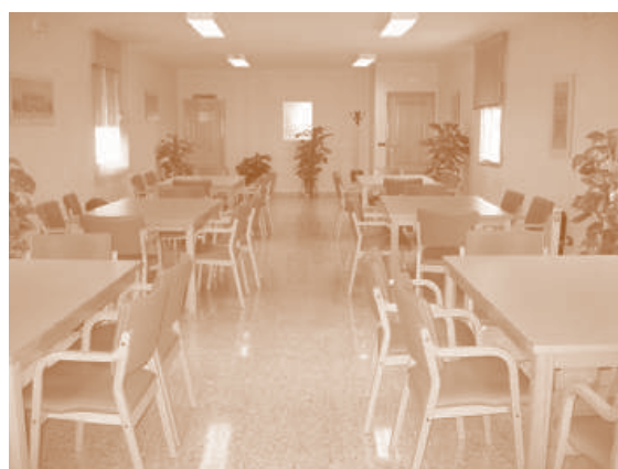
Sala de estudio