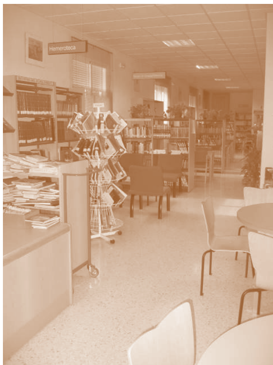
La biblioteca pública municipal de Huelma antes de la reforma del año 2003