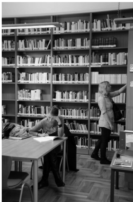
Dos imágenes de la sala de lectura

una diversificación clara y adecuada de funciones. La situación actual no es la más propicia para invertir en personal y menos en bibliotecas. El personal humano es el factor clave si queremos seguir cumpliendo nuestra misión, y no me refiero sólo a las bibliotecas del Cervantes.