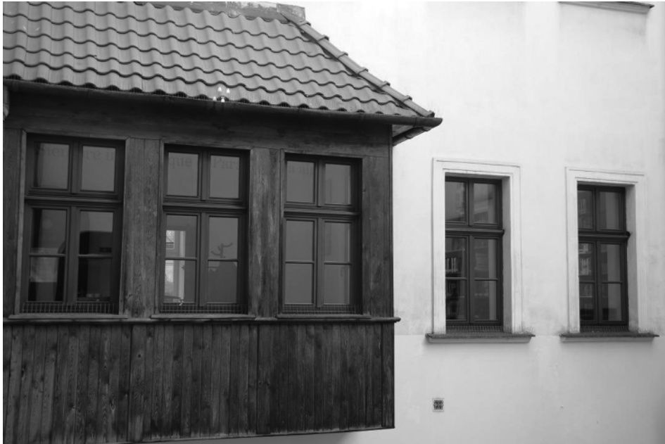
Una imagen del exterior del edificio

La educación figura en un lugar destacado en la escala de valores de la sociedad polaca, lo que se traduce en un gran apoyo del entorno familiar a los alumnos. Es un país sin analfabetismo y con una tasa muy baja de fracaso escolar en todas las etapas educativas, particularmente en las no universitarias. El gasto anual que el país dedica a educación por alumno como porcentaje del PIB está por encima de la media de la OCDE.