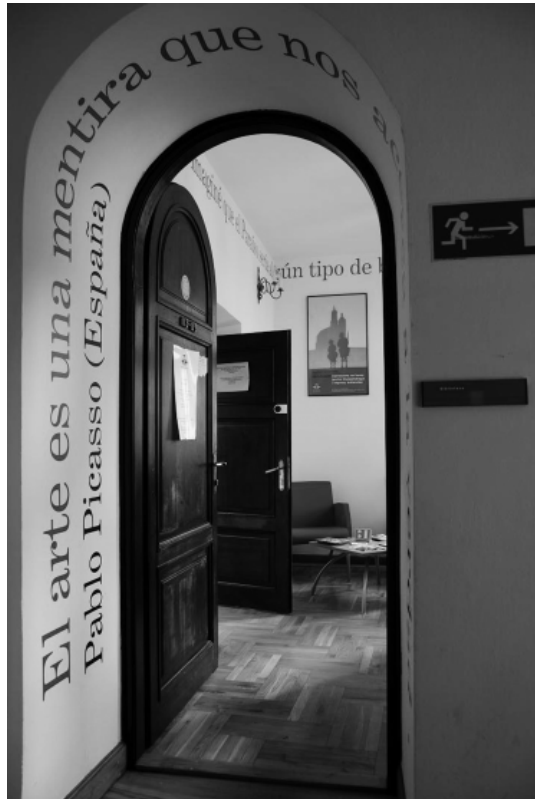
El vestíbulo de la biblioteca

Para los que trabajamos en la biblioteca del Instituto Cervantes de Cracovia, 2009 supuso un año de conocimiento (de la institución, del centro, del funcionamiento de la RBIC), de asentamiento, de creación de las pautas de trabajo que habrá que ir desarrollando en los próximos años, de mucho trabajo, de dudas e incertidumbres. A inicios de 2009, abordamos algunos de los problemas de la biblioteca y establecimos líneas de actuación. Sin el apoyo y aliento de las personas que forman