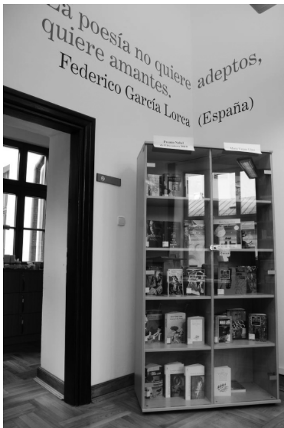
Un rincón de la biblioteca

La media de edad de los usuarios locales que acuden a la biblioteca se enmarca entre los 20 y 35-40 años de edad, un público joven, con necesidades e inquietudes determinadas, con interés por la cultura española e hispanoamericana, sobre todo, por nuestro cine, nuestra música, y con deseos, incluso, de establecerse en España.