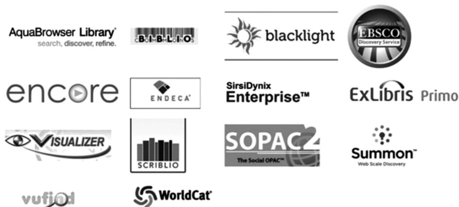
Fig. 2 Marshall Breeding “Discovery Products” (2010)

de la industria de la automatización de bibliotecas está moviéndose hacia un cada vez mayor componente de software libre, la industria está aún dominada por los tradicionales sistemas comerciales licenciados como ya hemos comentado. En este sentido hay que señalar el aumento fuerte en las ventas de los productos de descubrimiento [xxi], ofertados mayoritariamente por las empresas comerciales y que ofrecen acceso integrado a las colecciones locales y de artículos y documentos de las bases de datos, dentro y fuera de los recursos bibliotecarios.