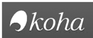
Figura 14. http://www.koha.org