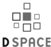
Figura 4. http://www.dspace.org

Es un programa de gestión de depósitos digitales institucionales, desarrollado por el MIT y HP. Su finalidad es recopilar, organizar y preservar la producción científica de una institución.