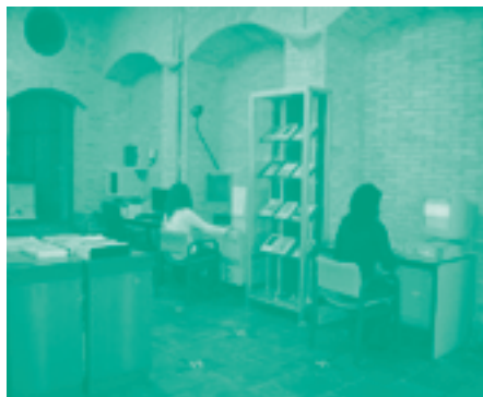
Foto 4. Zona de Opac y lectores de microfilm