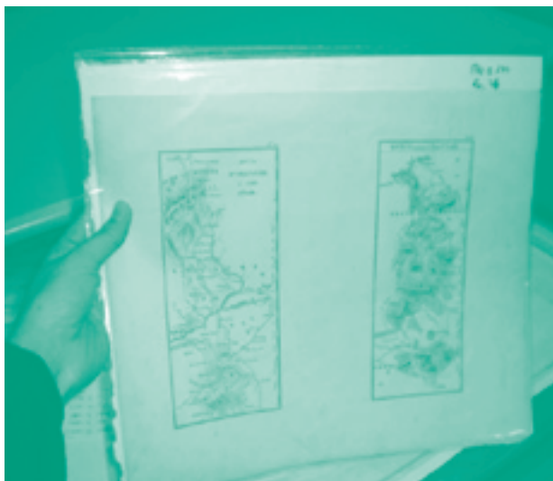
Foto 5. Material cartográfico

Destacar la Sección de Cartografía , en la que podemos encontrar entre otros, la casi totalidad de la obra cumbre del cartógrafo giennense Francisco Coello de Portugal y Quesada Atlas de España y sus posesiones de ultramar , realizado en colaboración con Pascual Madoz entre 1848 y 1870.