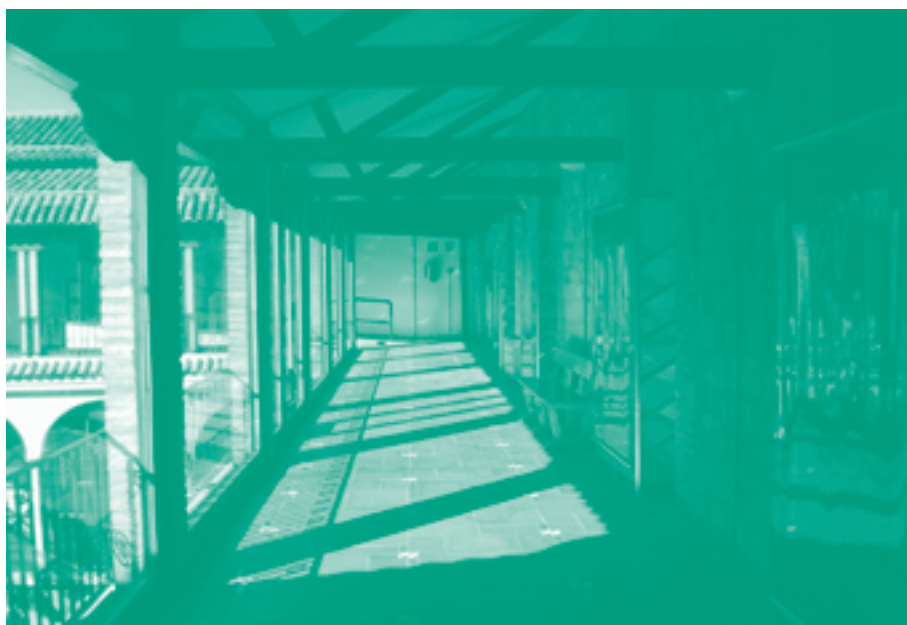
Foto 23. Depósito de microfilm