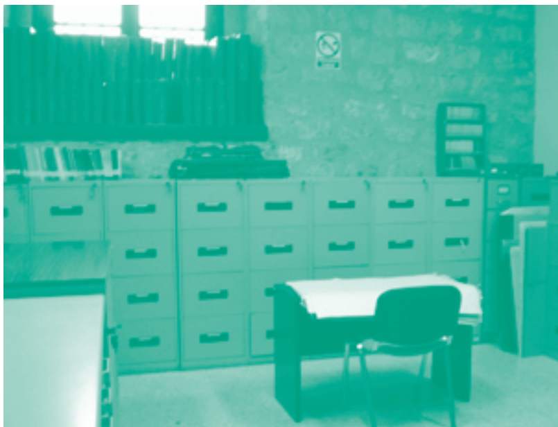
Foto 17. Depósito de libros, grabados y cartografía