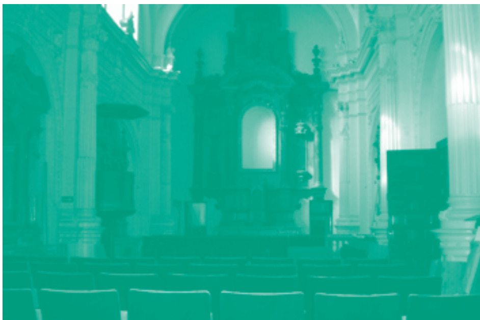
Foto 22. Antigua Capilla, hoy Salón de Actos