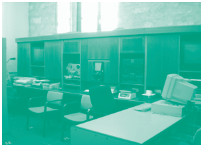
Foto 18. Depósito de imágenes