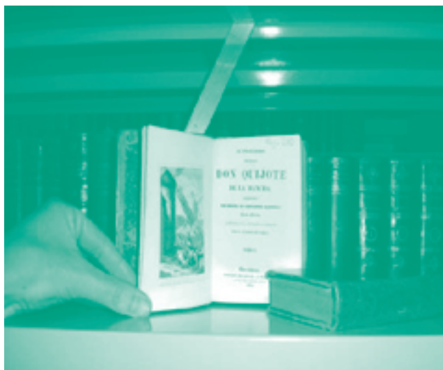
Foto 10. Depósito de monografías

Para la Sección de Libros modernos , la biblioteca adquiere, las últimas publicaciones, las más novedosas que hacen que su colección esté viva y actualizada.