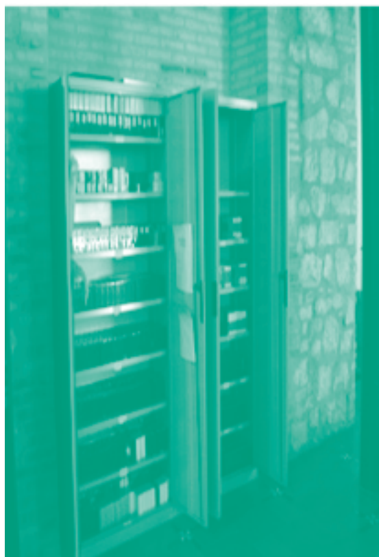
Foto 21. Hemeroteca