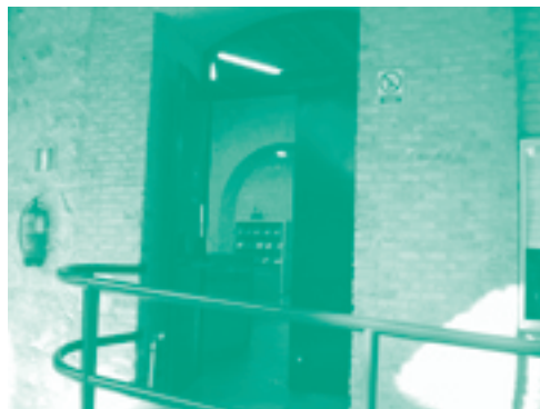
Foto 2. Entrada de la biblioteca