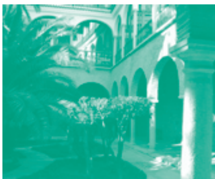
Foto 1. Patio central del edificio

Contamos para este Zom bibliotecario , con una breve entrevista del arquitecto, que amablemente nos atendió: