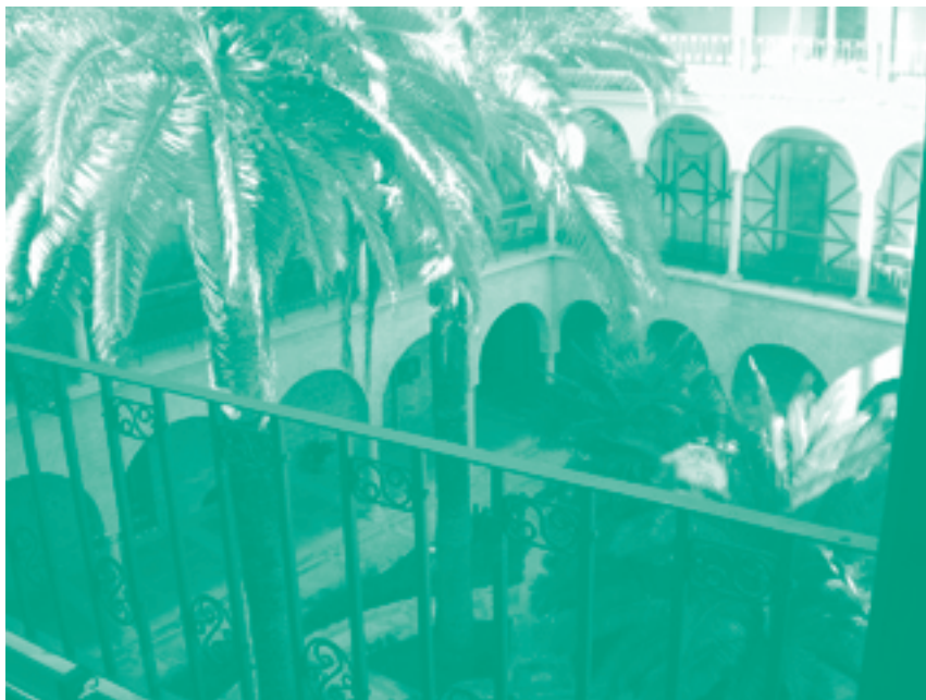
Foto 24. Galería 2ª planta