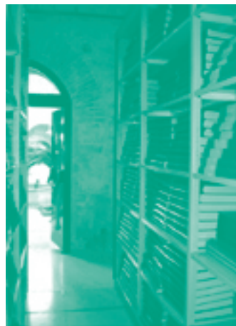
Fotos 19 y 20. Sala de Audiovisuales