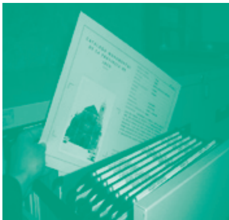
Foto 6. Material gráfico

La Sección de Hemeroteca recoge todo tipo de revistas y periódicos que se publican en la provincia. Destacamos la prensa histórica, que comienza en 1808 para la provincia de Jaén, se conservan tanto originales como copias microfilmadas de colecciones que se encuentran depositadas en la Biblioteca Nacional, la Hemeroteca Municipal de Madrid, el Archivo Histórico Nacional, colecciones privadas de la provincia., etc. Así nos encontramos con cabeceras locales como Guadalbullón (1846), Don Lope de Sosa (1913-1930), El Cero (1867), El Diluvio (1873), El Eco Minero (1876), La Luz de la Verdad (1891), Patria Chica (1916), La Hormiga (1896).